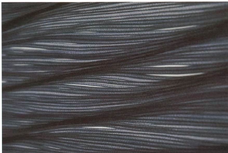
Vlna, 2020, fix na papíře, roláž, 70 x 100 cm